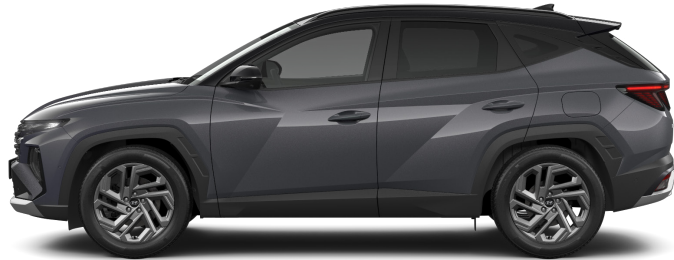
Ecotronic Grey Pearl