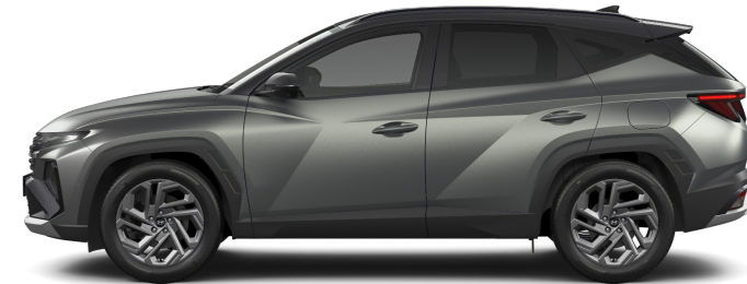
Pine Green Matt