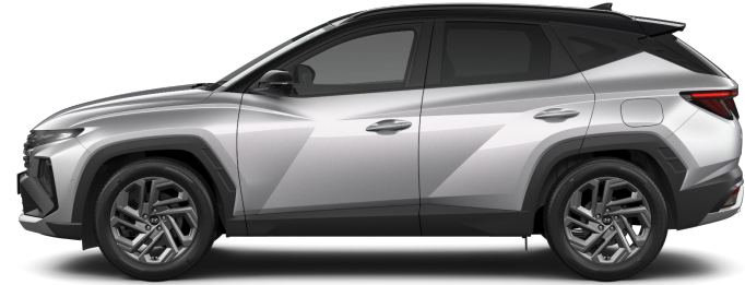
Shimmering Silver Metallic