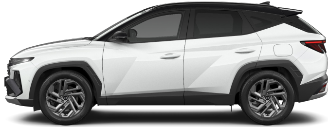
Serenity White Pearl